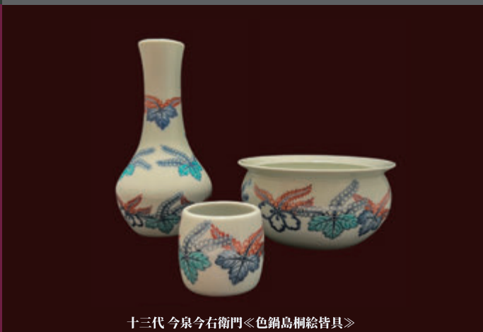
十三代 今泉今右衛門《色鍋島桐絵皆具》