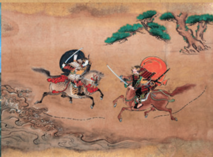
《敦盛絵巻》江戸時代前期